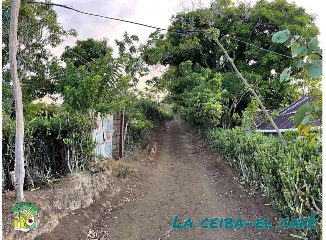
LA CEIBA-EL CAFÉ