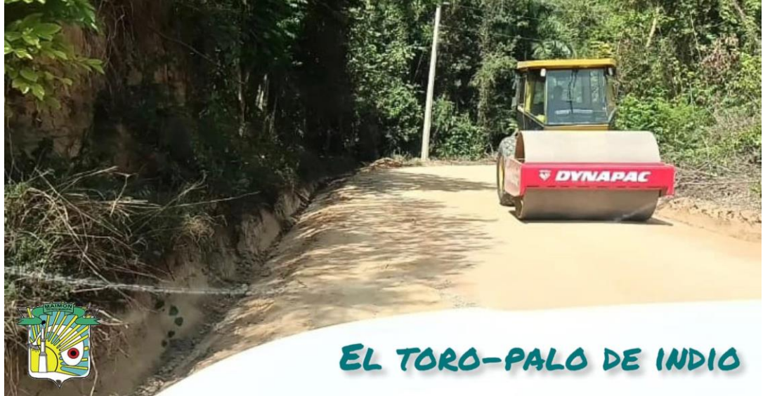
EL TORO-PALO DE INDIO