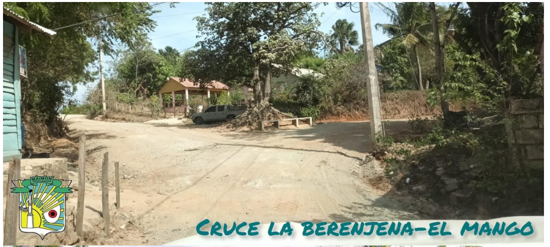
CRUCE LA BERENJENA-EL MANGO